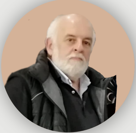
Fernando Vargas-Maza Arquitectura - 1975 Orden Séneca 2023