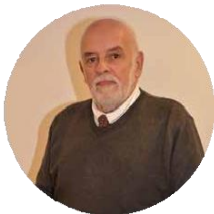
Fernando Vargas-Maza Arquitectura - 1975 PRESIDENTE